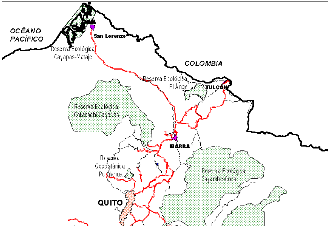
Mapa 1. El Ángel en el contexto regional.

Nuestra área de interés fundamental es la subcuenca del río El Ángel en la provincia del Carchi, norte del Ecuador. Si bien en la actualidad es una zona marginal al flujo turístico en el Ecuador, es una zona clave por tres razones: a) Contiene una variedad y diversidad de atractivos turísticos, entre los que sobresale la Reserva Ecológica El Ángel por la característica de sus páramos; b) Colinda con Colombia, siendo la puerta de entrada Ipiales – Tulcán, el segundo puerto de entrada al Ecuador después del aeropuerto internacional de la ciudad de Quito; y c) Se encuentra relativamente cerca de la ciudad de Quito, con la que se conecta a través de una excelente carretera, y a muy poca distancia de Otavalo, tal vez el punto de atracción más visitado del Ecuador después de Islas Galápagos.